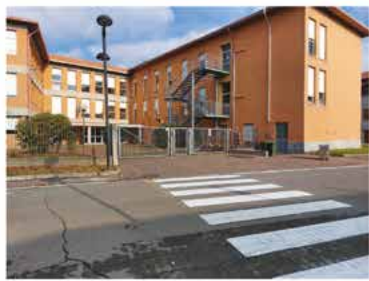
Ingresso Scuola primaria don Beretta