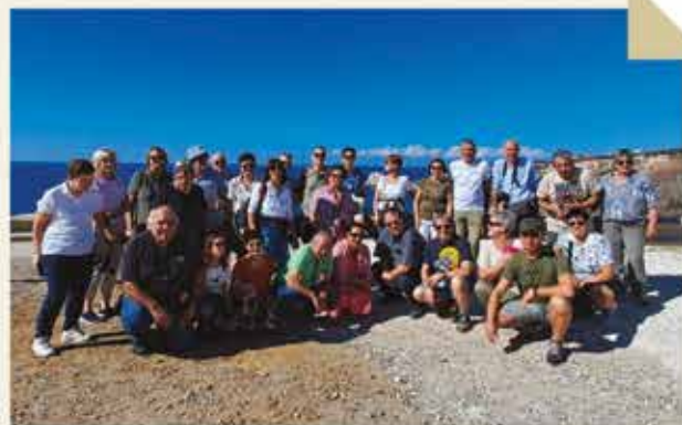
Pellegrinaggio a Cipro della Comunità Pastorale, sulle orme di San Paolo, San Barnaba e di San Marco (evangelista), 14-18 ottobre.