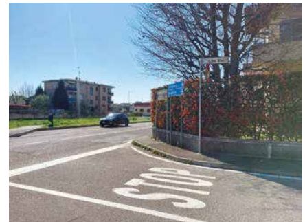
Via Leonardo Da Vinci