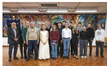
Vincitori di categoria