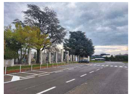
Cimitero di Giussano, lato Birone