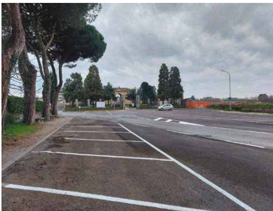
Cimitero di Giussano, lato Giussano

Gli interventi hanno interessato anche altre zone del territorio: a Paina in via Fiume , via Leonardo da Vinci , via Mantova , via Giusti (comprensiva degli stalli di sosta) e in via Statuto , con il rifacimento della linea gialla della pista ciclabile; a Robbiano via Tonale , con il rifacimento della mezzeria. Avviati a partire dai primi giorni di marzo, i lavori rientrano in una più ampia programmazione finalizzata a garantire una segnaletica sempre più visibile ed efficace, a tutela di automobilisti, pedoni e ciclisti.