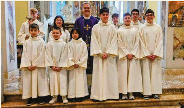
Nuovi chierichetti e cerimonieri della parrocchia di Giussano e di Robbiano