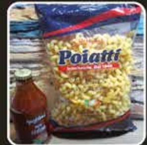
Riconoscimento ai primi 300 iscritti