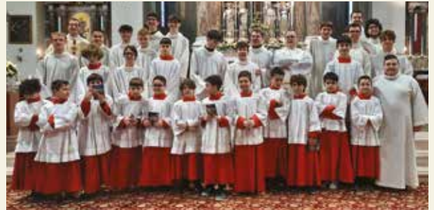
Sopra i chierichetti Robbiano sotto quelli di Giussano