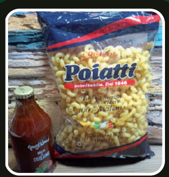
Riconoscimento ai primi 300 iscritti